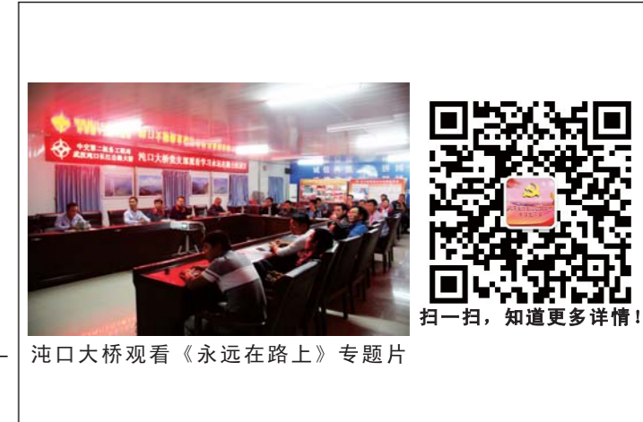
沌口大桥观看《永远在路上》专题片

中交二航局武汉沌口长江公路大桥项目部主办 第23期(总第23期)2016年10月[内部资料] 刊名题写：蒋成双 顾问：徐刚 李潜军 主编：田春华 张伟 编辑：柯祥虎