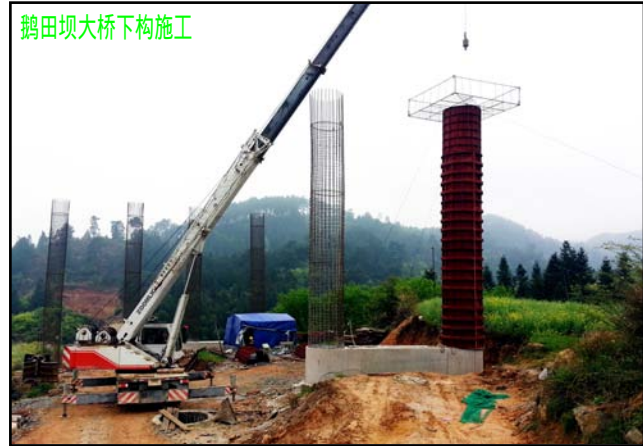
鹤田坝大桥下构施工

本报讯 截止三月底，项目部累计完成桩基58根，占总数的35%，为桥梁顺利施工奠定了基础。