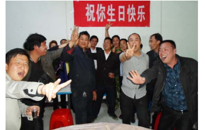
奉献之歌 上接第四版