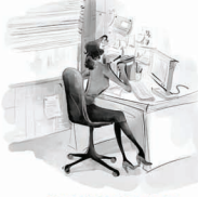
敬读读书,获取知识