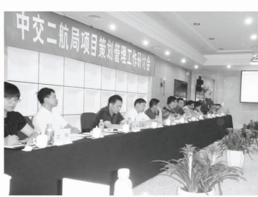
中交二航局项目部策划管理工作会议