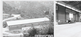
凯羊加工区实景图