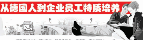
从德国人到企业员工特质培养